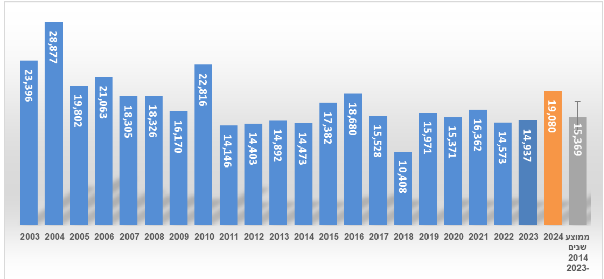
איור 1: קורמורנים חורפים בישראל, 2003-2024

עליה במספרי הקורמורנים נצפתה ברוב האזורים בארץ (איור 2). עיקר השינוי במספר הכולל לעומת שנים קודמות נובע מעליה באתרי הלינה בגאון הירדן (+2,000 לעומת שנה שעברה), ובנחל חדרה (+1,000), וכן באתרי שיחור המזון בערבה הדרומית (+1,200).